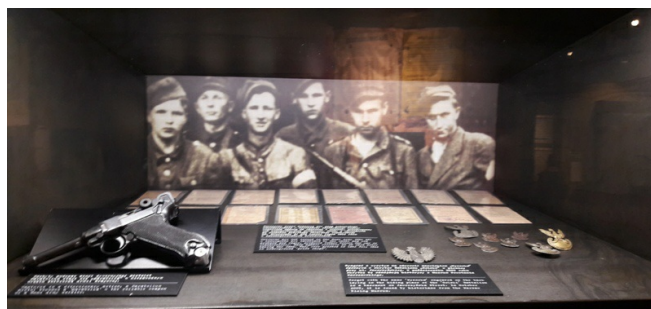
Niemie świadkowie historii