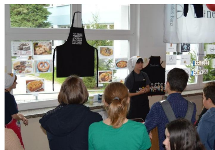
Kącik kulinarny cieszył się bardzo dużym powodzeniem. Ciekawe, dlaczego? Chyba to "wina" słynnych niemieckich precelków!.

Podczas naszej "wycieczki" poznawaliśmy kulturę Niemiec, odwiedzając 10 tematycznych stacji. Dowiedzieliśmy się, jak wygląda tradycyjna kuchnia niemiecka i jakiej muzyki słuchają nasi koledzy zza Odry. Poznaliśmy wybitne postaci związane z literaturą, sztuką, muzyką i sportem. Zobaczyliśmy najsłynniejsze niemieckie marki i produkty, a nawet tradycyjne stroje z Bawarii, w które ubrani byli nasi koledzy z klas 8 wraz z panią Sylwią.