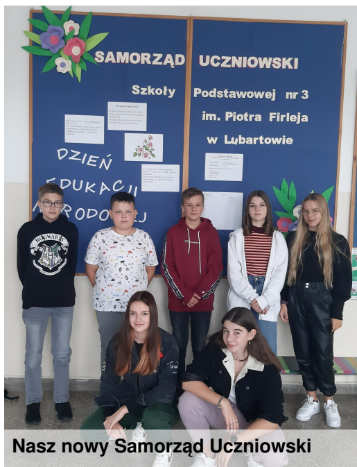
Nasz nowy Samorząd Uczniowski