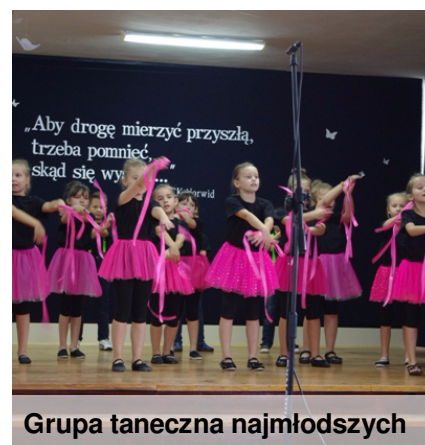
Grupa taneczna najmłodszych