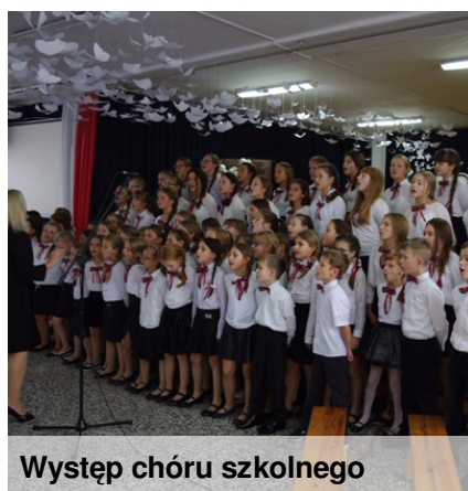
Występ chóru szkolnego