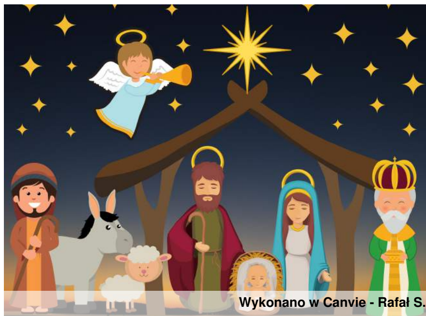
Wykonano w Canvie - Rafał S.