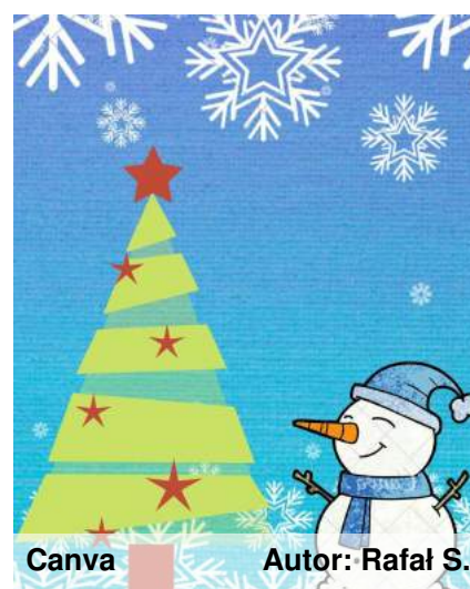
Canva Autor: Rafał S.