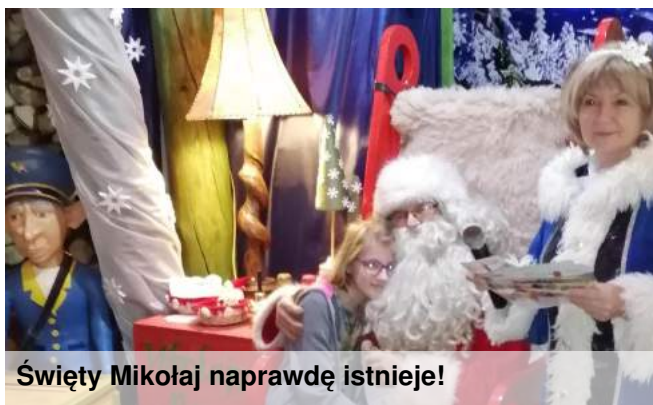
Święty Mikołaj naprawdę istnieje!