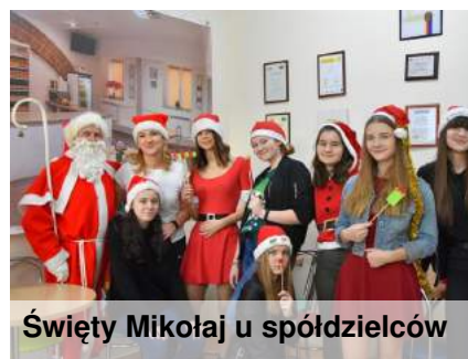
Święty Mikołaj u spółdzielców