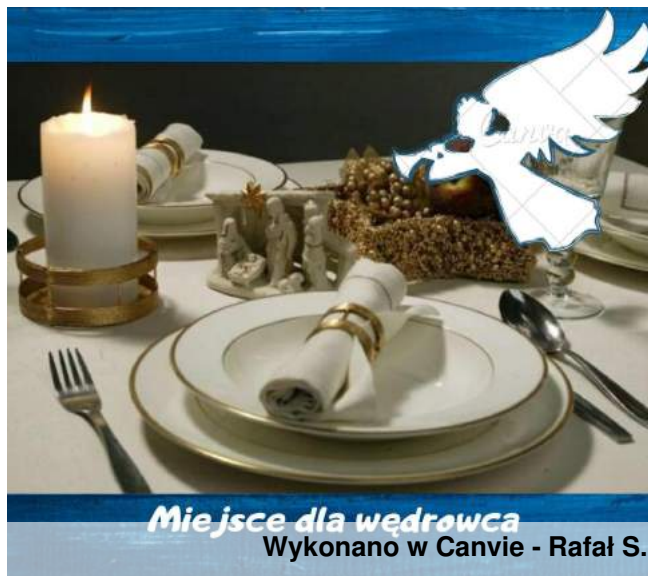
Miejsce dla wędrowca