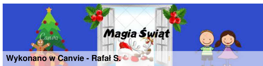
Wykonano w Canvie - Rafał S.