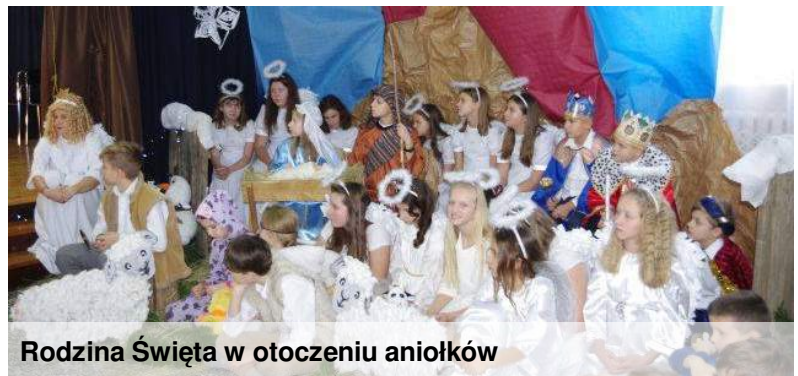
Rodzina Święta w otoczeniu aniołków