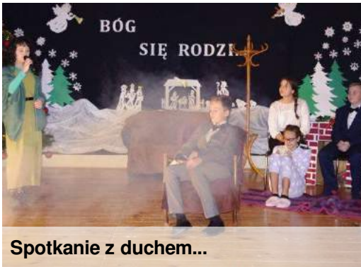
Spotkanie z duchem...