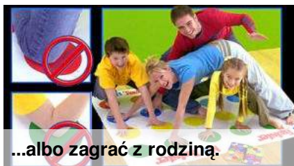
...albo zagrać z rodziną.