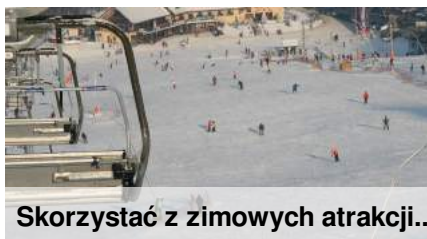
Skorzystać z zimowych atrakcji..