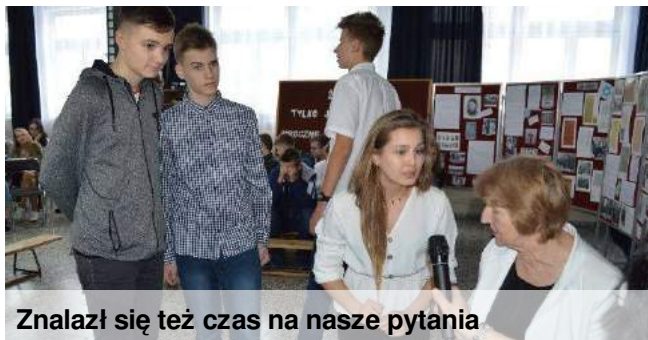
Znalazł się też czas na nasze pytania