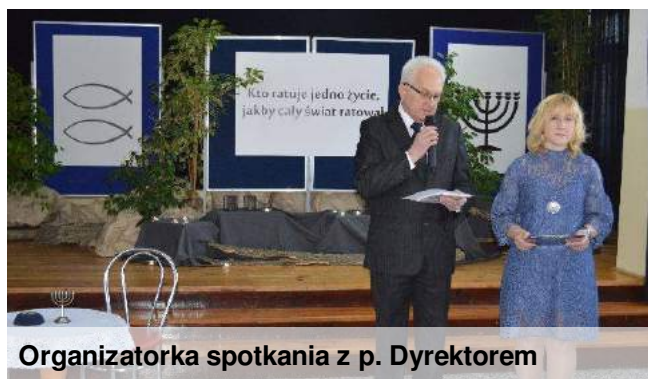
Organizatorka spotkania z p. Dyrektorem

Po wybuchu wojny Niemcy mordowali osoby wyznania mojżeszowego w podbitych przez nich krajach. Polska była jedynym krajem, w którym za pomoc Żydom groziła kara śmierci. Jednak nie przstraszyło to naszych rodaków, którzy ofiarne i z narażeniem życia pomagali Żydom.