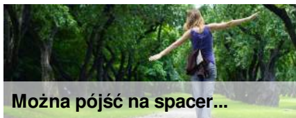
Można pójść na spacer...