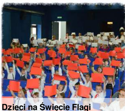
Dzieci na Święcie Flagi