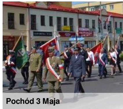
Pochód 3 Maja