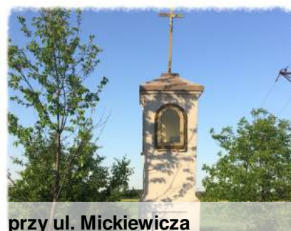
przy ul. Mickiewicza