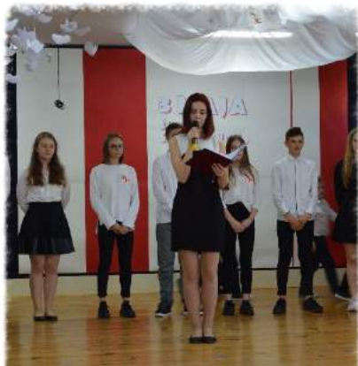
Akademia w Święto 3 Maja