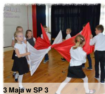
3 Maja w SP 3