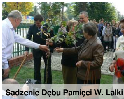
Sadzenie Dębu Pamięci W. Lalki