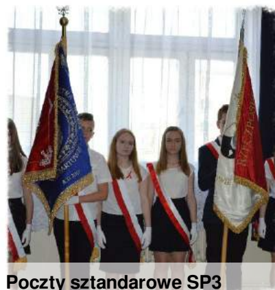
Poczty sztandarowe SP3