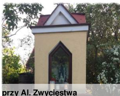
przy Al. Zwycięstwa