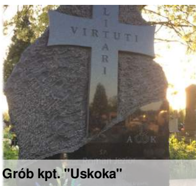
Grób kpt. "Uskoka"