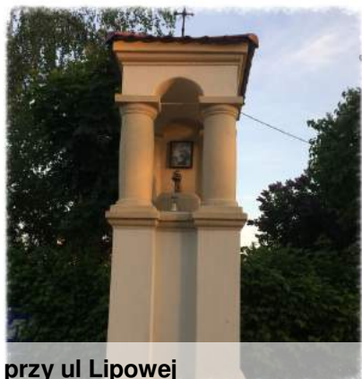
przy ul Lipowej