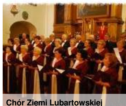
Chór Ziemi Lubartowskiej