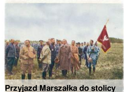
Przyjazd Marszałka do stolicy