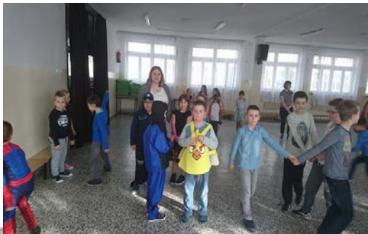
Tak bawiła się klasa 3 d.