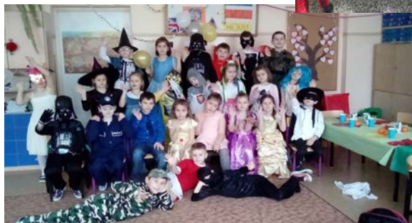
Bal karnawałowy w kl. O b