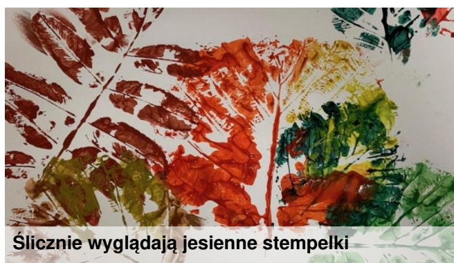
Ślicznie wyglądają jesienne stempelki