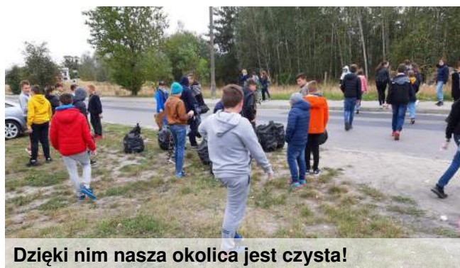
Dzięki nim nasza okolica jest czysta!