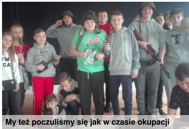
My też poczuliśmy się jak w czasie okupacji