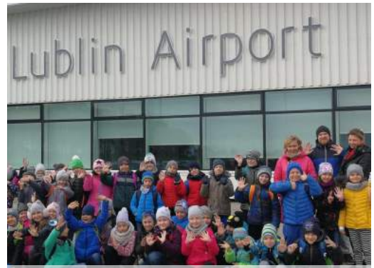
A może by tak polecieć w daleki świat?