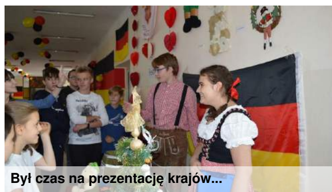
Był czas na prezentację krajów...