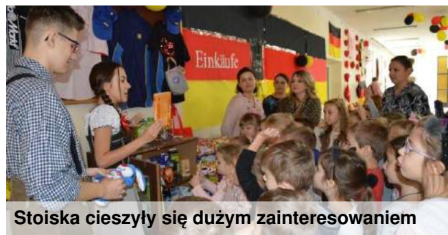
Stoiska cieszyły się dużym zainteresowaniem