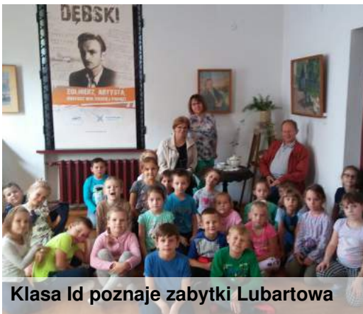
Klasa 1d poznaje zabytki Lubartowa