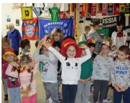
Podobał się Wam ten numer?