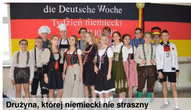
Drużyna, której niemiecki nie straszny