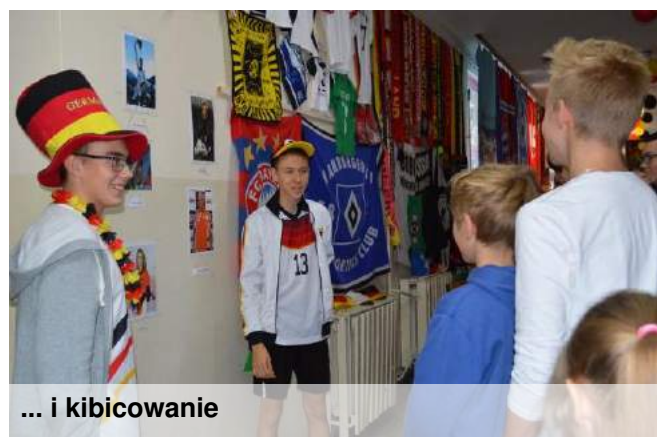
... i kibicowanie