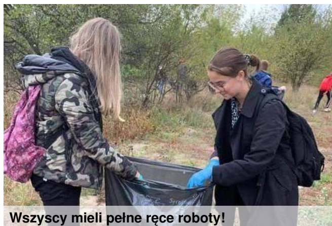
Wszyscy mieli pełne ręce roboty!

Rozmawiała: Weronika Duda, Olga Borowicz