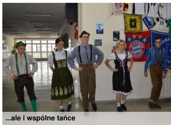
...ale i wspólne tańce