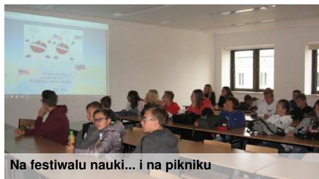
Na festiwalu nauki... i na pikniku