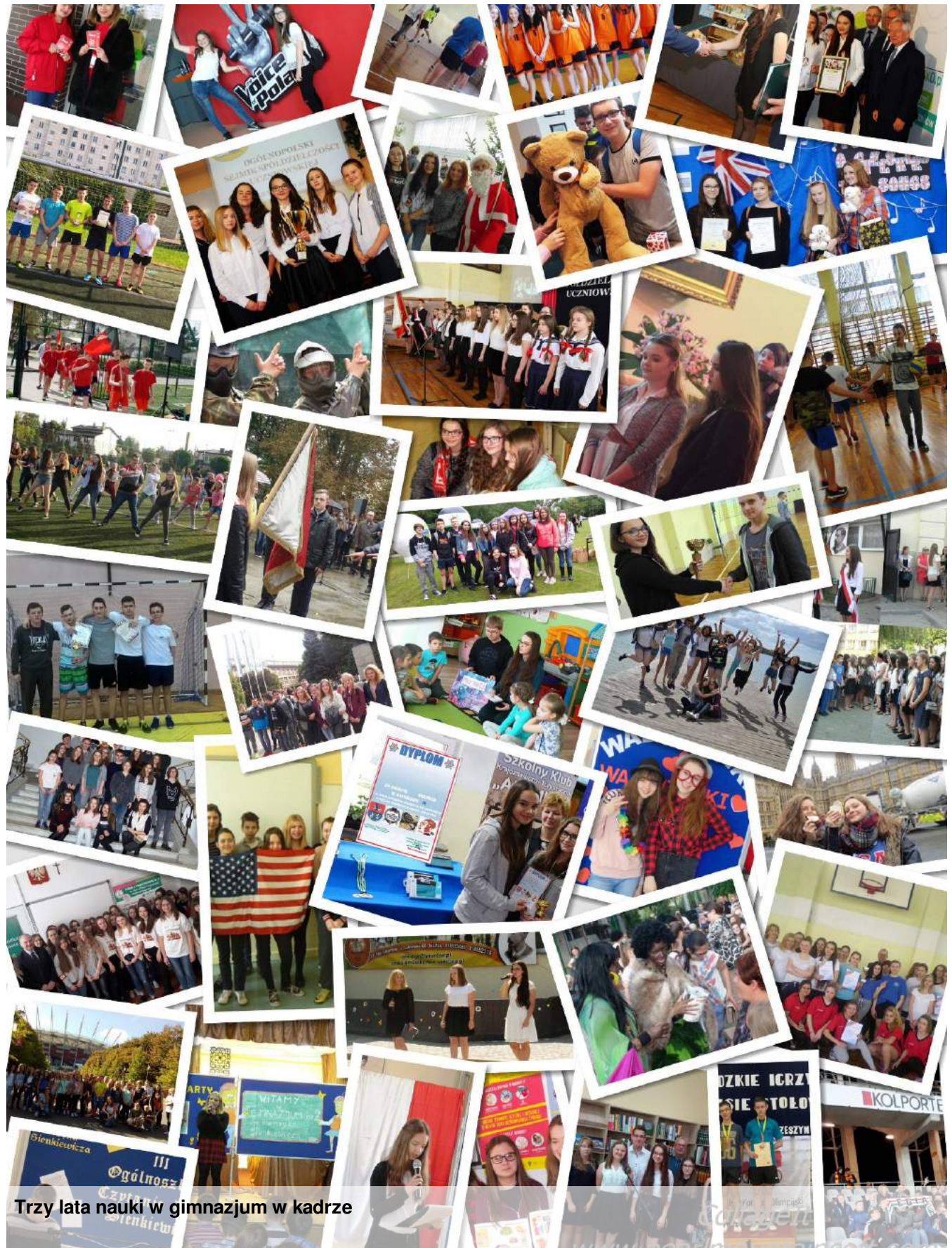
Trzy lata nauki w gimnazjum w kadrze