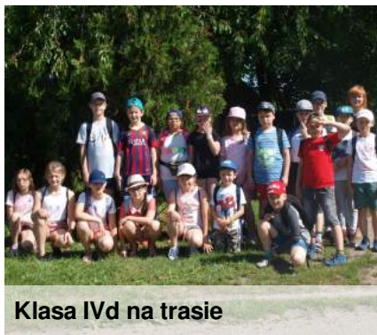
Klasa IVd na trasie