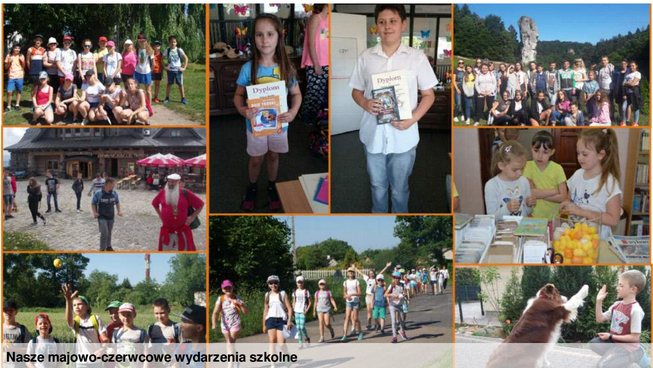
Nasze majowo-czerwcowe wydarzenia szkolne