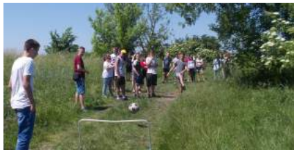
Na jednym z punktów...