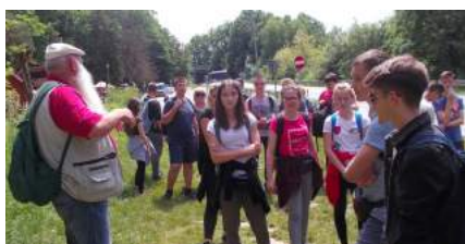
Pan przewodnik i my