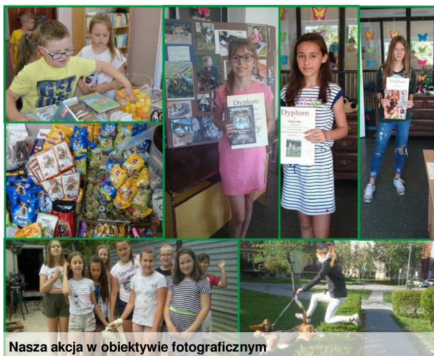
Nasza akcja w obiektywie fotograficznym