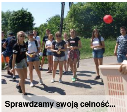
Sprawdzamy swoją celność...