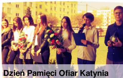
Dzień Pamięci Ofiar Katynia