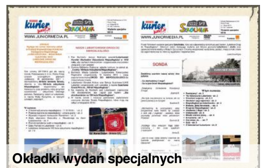
Okiadki wydań specjalnych