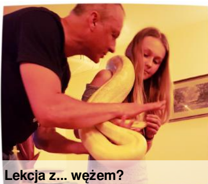
Lekcja z... węzem?