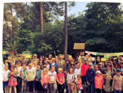
Nagrodzenie w konkursie