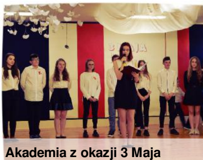
Akademia z okazji 3 Maja

9-osobowa grupa uczniów klas IIa i IIb gimnazjum realizująca projekt edukacyjny zaprosiła swoich kolegów i rodziców w wirtualną podróż po Berlinie. Oprac. Anna Aftyka