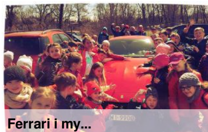
Ferrari i my...

nam również swoje autografy. To była wspaniała przygoda.