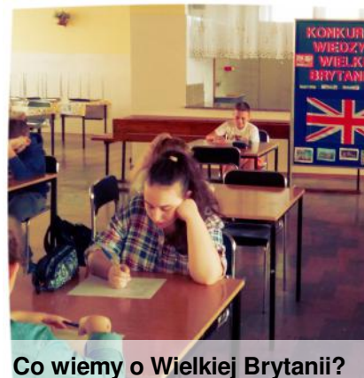
Co wiemy o Wielkiej Brytanii?