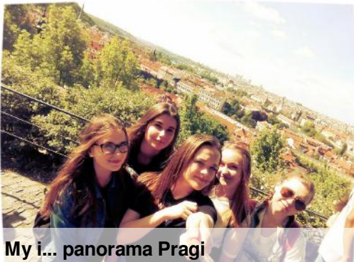
My i... panorama Pragi