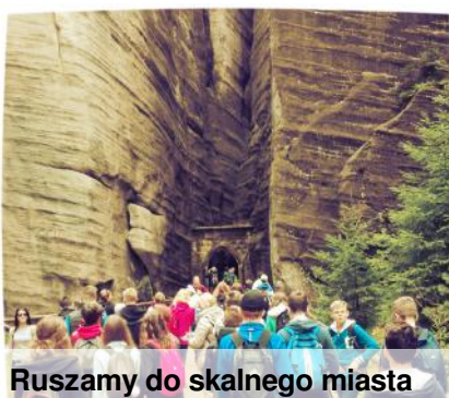
Ruszamy do skalnego miasta