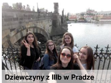
Dziewczyny z IIIb w Pradze