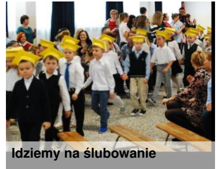
Idziemy na ślubowanie