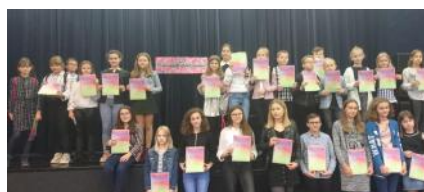
Jesienny Konkurs Recytatorski

17 października klasy: 2b, 2c, 2e uczestniczyły w lekcji multimedialnej połączonej z seansem filmowym „Pies ma głos”.