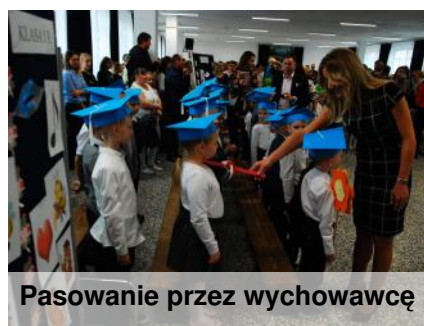
Pasowanie przez wychowawcę