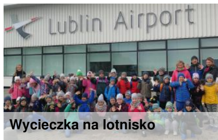
Wycieczka na lotnisko