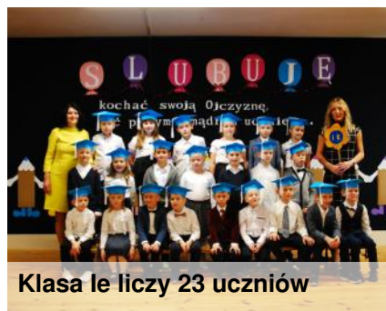
Klasa Ie liczy 23 uczniów