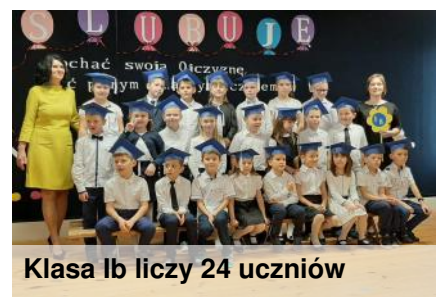
Klasa 1b liczy 24 uczniów