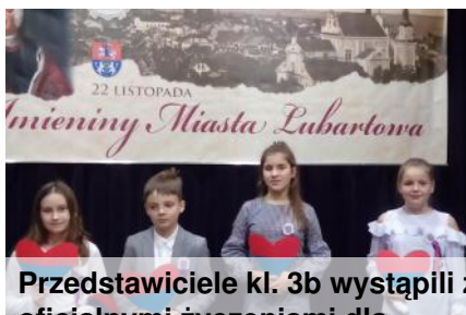
Przedstawiciele kl. 3b wystąpili : oficjalnymi życzeniami dla miasta