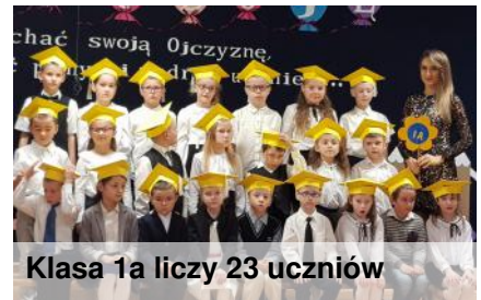
Klasa 1a liczy 23 uczniów