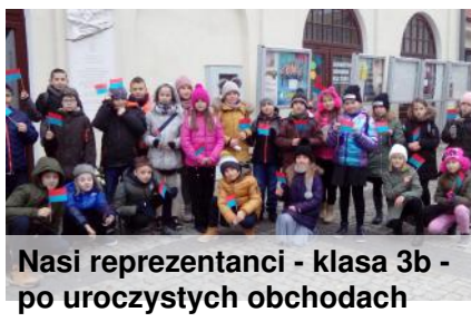
Nasi reprezentanci - klasa 3b - po uroczystych obchodach imienin Lubartowa