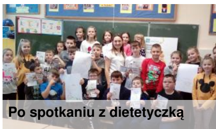
Po spotkaniu z dietetyczką