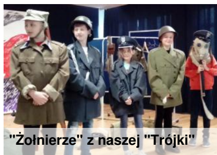
"Żołnierze" z naszej "Trójki"