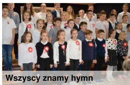
Wszyscy znamy hymn

Od września do listopada klasy I-III uczestniczyły w wielu wycieczkach. Były to zarówno wycieczki edukacyjne, jak i turystyczno-krajoznawcze. Dzieci poznawały najbliższą okolicę podczas spacerów po parku (1f, 2b, 2e), lesie (2d), i mieście (2b, 3b). Odwiedziły też różne instytucje miejskie: Muzeum Ziemi Lubartowskiej, Muzeum Parafialne (1d, 3a) czy Sanepid, w którym oglądały wystawę grzybów jadalnych (2a). Klasa 2g zawędrowała aż do Nadleśnictwa Lubartów. Klasa 1d odbyła spacer do Urzędu Poczтового, w którym wysłała list do św. Mikołaja. Klasa 1b pamiętała o zapaleniu zniczy na grobach żołnierzy. Były klasy, które na wycieczkę wyruszyły do Lublina. Na UMCS i do Muzeum Wsi Lubelskiej pojechała kl. 1f. W specjalnej lekcji multimedialnej o reklamie w kinie Olimp i filmie Pies ma głos wzięły udział klasy 1e, 2b, 2e, 3c i 3d. Lotnisko w Świdniku zwiedzały klasy 2d i 2g. Do plenerowej pracowni ceramiki i rękodzieła artystycznego - Żywioty Ziemi w Nowym Stawie udały się klasy 1e i 2c. Najdalej wyjechały klasy 3b i 3e, które zwiedzały Warszawę. W programie było zwiedzanie telewizji, objazd "pociągiem" wycieczkowym po Starym Mieście oraz zabawy doświadczalne w Centrum Nauki "Kopernik".