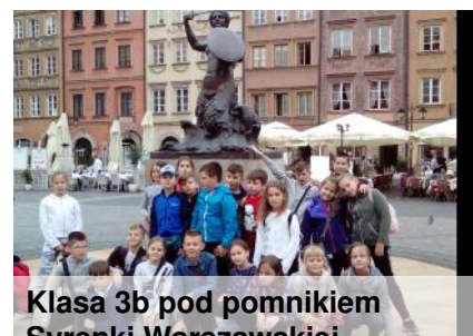
Klasa 3b pod pomnikiem Syrenki Warszawskiej