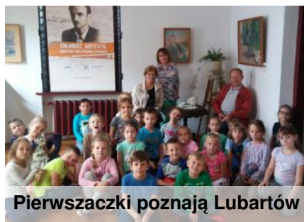
Pierwszaczki poznają Lubartów