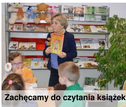
Zachęcamy do czytania książek