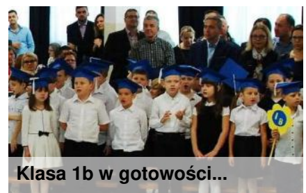
Klasa 1b w gotowości...