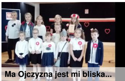
Ma Ojczyzna jest mi bliska...