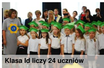
Klasa Id liczy 24 uczniów