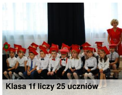
Klasa 1f liczy 25 uczniów