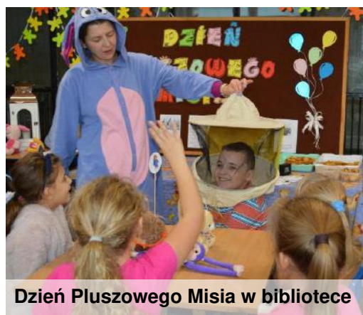
Dzień Pluszowego Misia w bibliotece