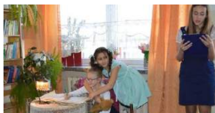
Gienusia z zapracowaną mamą