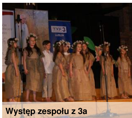
Występ zespołu z 3a