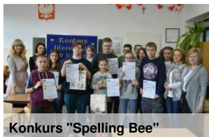
Konkurs "Spelling Bee"