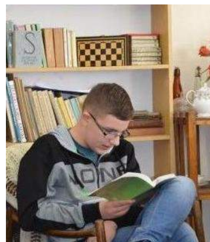
Czytamy, czytamy, czytamy...