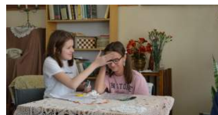
Dziewczyny z 6d w scenie