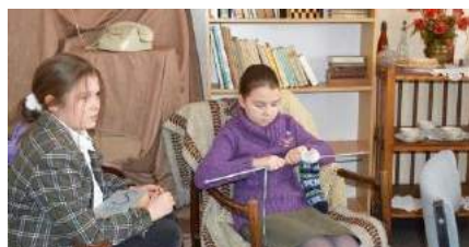
... dlatego odwiedzała obcych