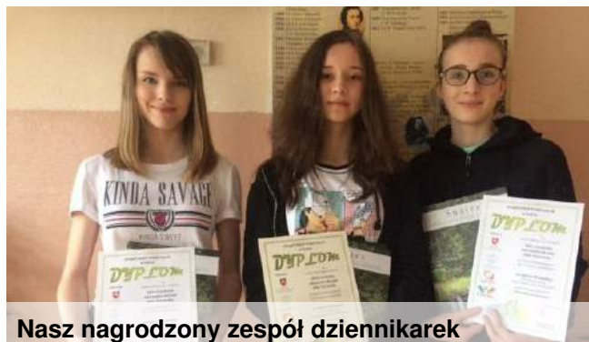
Nasz nagrodzony zespół dziennikarek