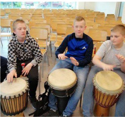
Odkrywamy rytmy afrykańskie