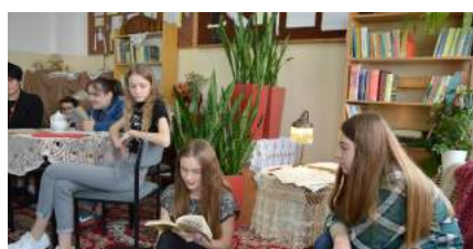
Klasa 7e czyta swoje fragmenty