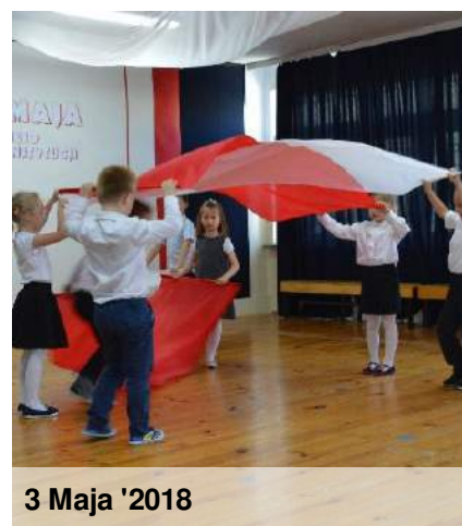
3 Maja '2018