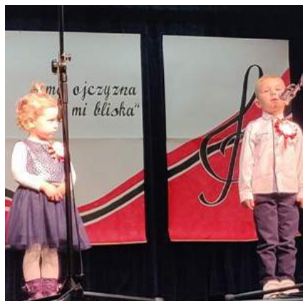
Festiwal patriotyczny trwa...