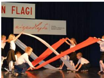
Tak, krok po kroku,