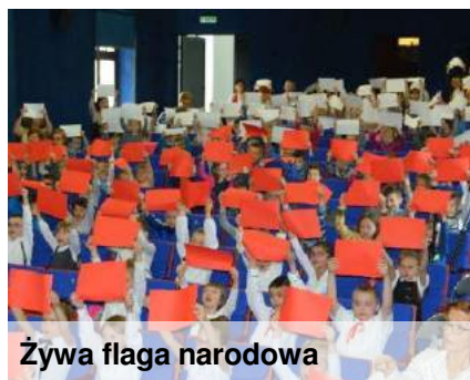
Żywa flaga narodowa