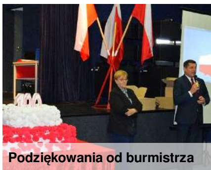
Podziękowania od burmistrza