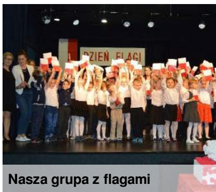
Nasza grupa z flagami