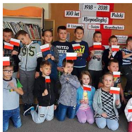
Warsztaty w świetlicy