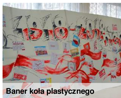
Baner koła plastycznego