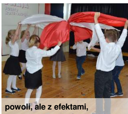
powoli, ale z efektami,