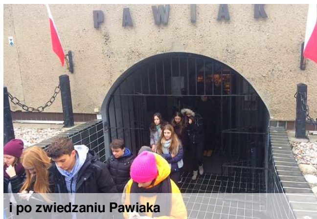
i po zwiedzaniu Pawiaka