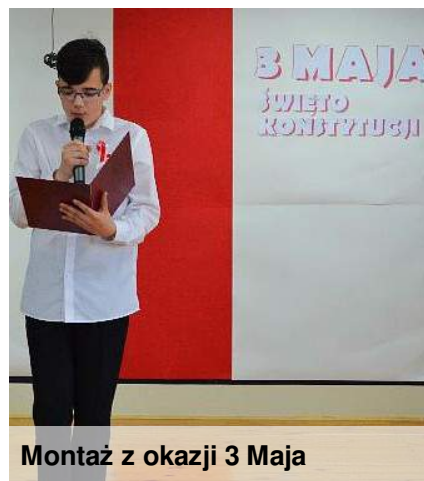
Montaż z okazji 3 Maja