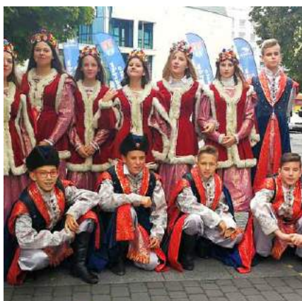
Grupa tańcząca poloneza