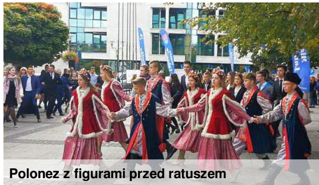
Polonez z figurami przed ratuszem