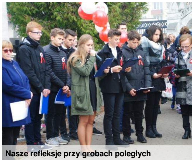
Nasze refleksje przy grobach poległych

Kwiaty złożone były na grobach: Bohaterów poległych w walce w latach 1831 i 1863 , na grobie Powstańców z 1863 roku z oddziałów Lewandowskiego i Bogdanowicza , na grobie Żołnierzy poległych w walce z okupantem niemieckim w latach II wojny światowej , na grobach Żołnierzy AK Obwodu Lubartów 27 Wołyńskiej Dywizji Piechoty , na grobie: Legionistów zmarłych po I i II wojnie światowej w 70. rocznicę odzyskania niepodległości oraz Żołnierzy poległych w 1920 r.