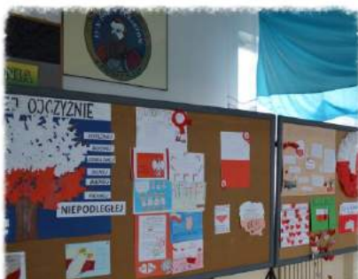
Życzenia dla Niepodległej