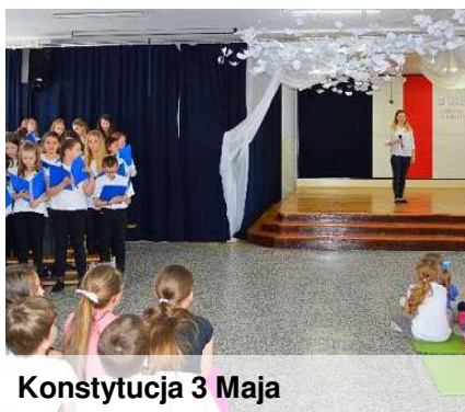
Konstytucja 3 Maja