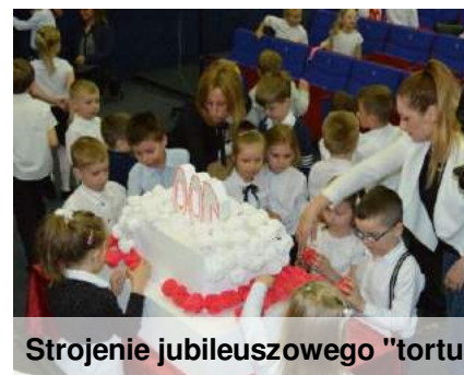
Strojenie jubileuszowego "tortu"