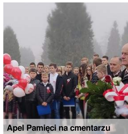
Apel Pamięci na cmentarzu