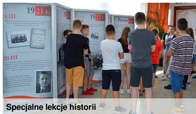
Specjalne lekcje historii