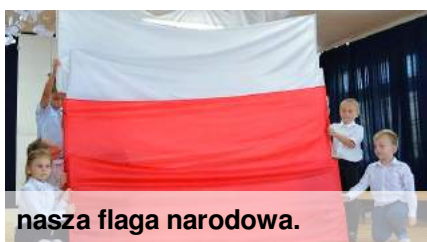
nasza flaga narodowa.