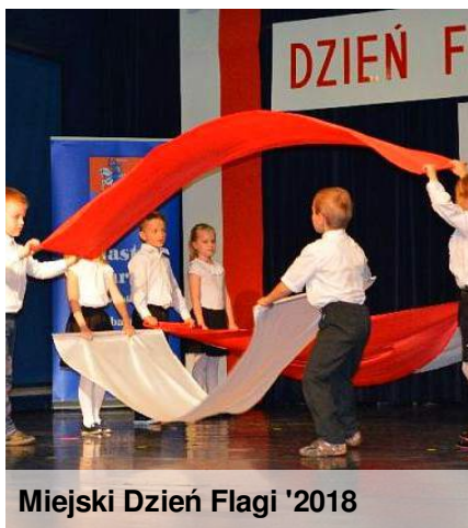
Miejski Dzień Flagi '2018