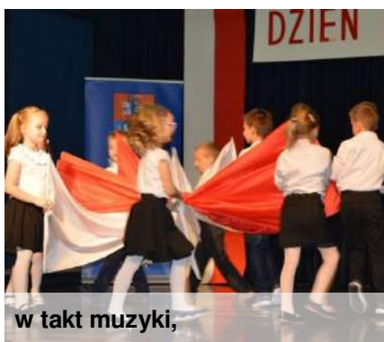
w takt muzyki,