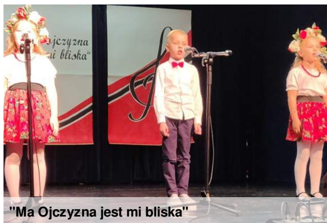
"Ma Ojczyzna jest mi bliska"