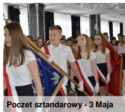
Poczet sztandarowy - 3 Maja