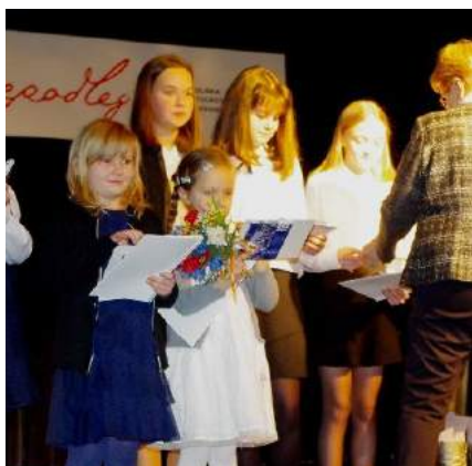
Podziękowania dla uczestników