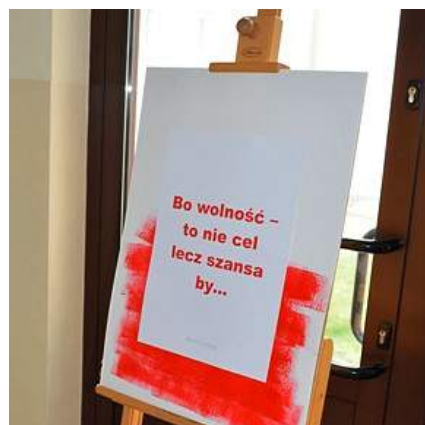
Dekoracja na korytarzach