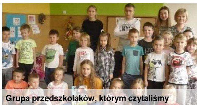
Grupa przedszkolaków, którym czytaliśmy