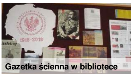
Gazetka ścienna w bibliotece