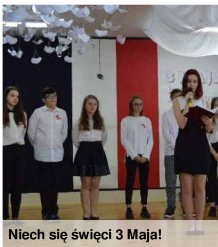
Niech się święci 3 Maja!