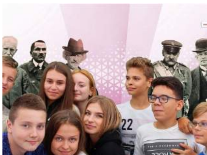
Ville z "ojcami" niepodległości