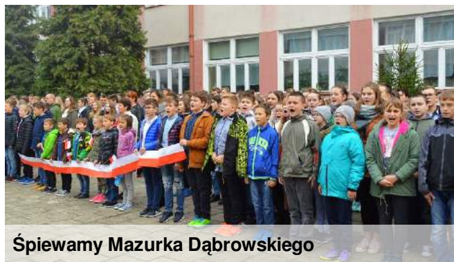
Śpiewamy Mazurka Dąbrowskiego