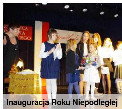
Inauguracja Roku Niepodległej